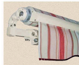
Tube carré autoporteur, section 40 x 40 x 1,50 en acier laqué. Support de tube enrouleur et support de pose en aluminium extrudé.