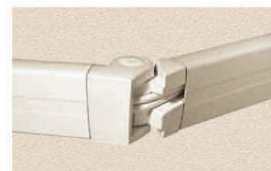
Bras en aluminium extrudé pour projection de 1,50 à 3 m d'avancée, avec double câble en acier gainé.